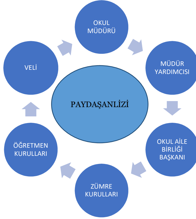
Paydaş Sınıflandırma Matrisi

Kurumumuzun temel paydaşları öğrenci, veli ve öğretmen olmakla birlikte eğitimin dışsal etkisi nedeniyle okul çevresinde etkileşim içinde bulunan geniş bir paydaş kitlesi bulunmaktadır. Paydaşlarımızın görüşleri anket, toplantı, dilek ve istek kutuları, elektronik ortamda iletilen önerilerde dâhil olmak üzere çeşitli yöntemlerle sürekli olarak alınmaktadır.